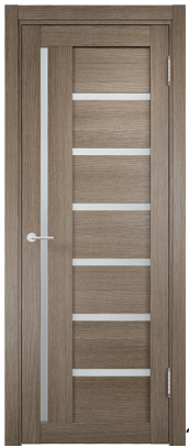
?????? 01 ??, ??? ????????